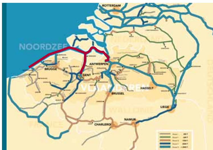
Gebied gedekt door AIS-ontvangststations

De waterwegbeheerders zijn zich ervan bewust dat de schipperij daar – terecht – bezorgd over is. Daarnaast beseffen zij het belang van de AIS-informatie voor de eindklant, die dankzij die gegevens een beter beeld krijgt van hoe het transport vordert. Die service bieden het wegvrachtverkeer, de spoorweg, de zeevaart en de luchtvaart nu al. Bij de behandeling van AIS-gegevens zullen de waterwegbeheerders in elk geval rekening houden met de wetgeving en met de wensen van de betrokkenen.